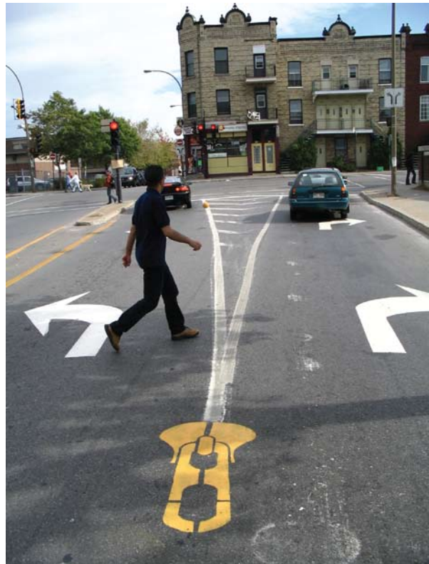
Roadsworth © Peter Gibson, Montreal 2006

Aan de hand van een ongekende collectie werken van achttien van de meest getalenteerde internationale kunstenaars van dit moment, bijeengebracht door samensteller Scott Burnham, onderzoekt de tentoonstelling hoe deze nieuwste golf van interactie met het stedelijke landschap een uitdaging vormt voor de gebruikelijke omgangsvormen tussen burgers en voor de officieel gesanctioneerde vormen van stedelijke creativiteit. Bovendien verdiept de tentoonstelling zich in de vraag hoe de taal van creativiteit in de stad verandert. Hoewel deze ingrepen in het stedelijke landschap in de ogen van sommigen worden afgedaan als vormen van vandalisme, ligt aan deze huidige golf van doe-het-zelf stedelijk ontwerp in wezen een uiterst geraffineerde beweging ten grondslag, die wordt aangedreven door kunstenaars en designers die de relatie tussen creativiteit en de stad een nieuwe dimensie willen geven. De grote variëteit aan getoonde projecten, die zonder officiële toestemming of onder auspiciën van commissies tot stand kwamen, vertegenwoordigen het kruispunt van de nieuwste genres van straatkunst en de geboorte van 'open source' stedelijk design.