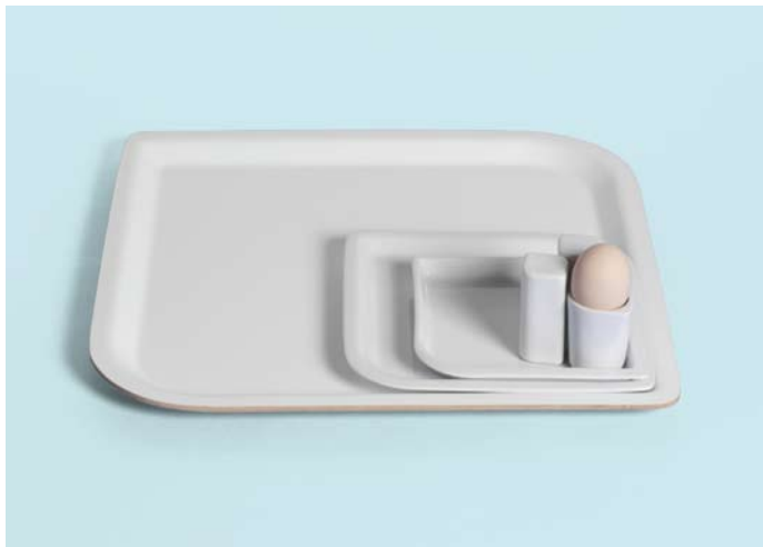
City Brunch, Matali Crasset

Aansluitend op een traditie die het kritische debat wil bevorderen en deelname en betrokkenheid wil aanmoedigen, presenteert ExperimentaDesign Amsterdam 2008 gedurende de Opening Week een serie Open Talks: in een informele setting gaan internationale experts en toonaangevende persoonlijkheden in debat met het publiek over vraagstukken rond de thema's die de centrale tentoonstellingen van de Biënnale oproepen. Een gastspreker introduceert het thema, waarna de overige uitgenodigde sprekers een korte reactie kunnen geven. Vervolgens leidt de gespreksleider het debat tussen de sprekers, terwijl daartoe speciaal uitgenodigde 'agents provocateurs' en leden van het publiek zich vrijelijk in de discussies kunnen mengen. Elke Open Talks-sessie weerspiegelt het thema van de tentoonstelling die op diezelfde dag wordt geopend, waardoor de sessie voor bezoekers en publiek fungeert als katalysator voor nadere beschouwing.