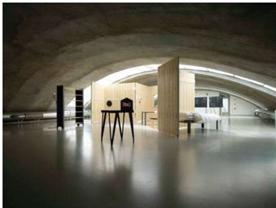
Tuis © Christoph Seyferth

In samenklank met de thema's, disciplines en reikwijdte van ExperimentaDesign Amsterdam 2008 zal tijdens de Biënnale door de hele stad heen een aantal nevenprogramma's plaatsvinden. Onafhankelijke kunstenaars, ontwerpers en culturele bemiddelaars uit verschillende landen delen het engagement van EXD met de stad Amsterdam als een internationaal podium voor experiment en innovatie in de stedelijk cultuurpraktijk.