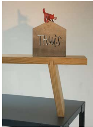
Thuis © Christoph Seyferth

Deze 'thuis'-collectie vertegenwoordigt een tijdloze cluster van objecten, heruitgevonden voor onze tijd als antwoord op de roep om een plek voor onszelf, een plek die we 'thuis' noemen.