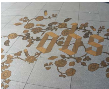
Stefan Sagmeister Inc.